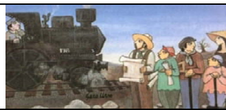
MARCHIROLO - VARESE