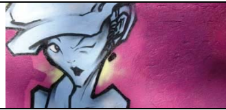
DESIO -MONZA -MILANO