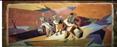
MARCHIROLO - VARESE