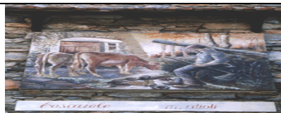
BOAREZZO - VARESE