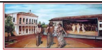
MURALES DI CALCIO -BG-

Albaredo per San Marco (SO) Aprica (SO) Arcumeggia-Casalzuignu (VA) Boarezzo di Valganna (VA) Cadorago (CO) Calcio (BG) Cerete (BG) Dairago (MI) Dossena (BG) Barbavara di Gravelona Lomellina (PV) Marchirolo (VA) Madone (BG) Olona di Induno Olona (VA) Rovascio di Tavernerio (CO) Runo di Dumenza (VA) San Fermo di Varese (VA) Val Masino (SO). ... Murales belli e meno belli , sempre e comunque interessanti, possono offrire uno spunto di riflessione e ci danno la possibilità di visitare luoghi poco conosciuti delle Province Lombarde, con una escursione nel week end, alla scoperta di questi Muri d'autore e delle delizie gastronomiche della zona e magari dare spunto a qualche Writer di dedicarsi al VERO MURALISMO ARTISTICO