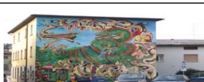
MADONE - BERGAMO