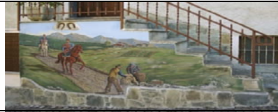
ALBAREDO - S.MARCO - SONDRIO