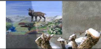
APRICA - SONDRIO