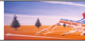
CERETE - COMO