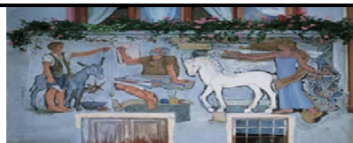
MURALES DI ARCUMEGGIA -VA-