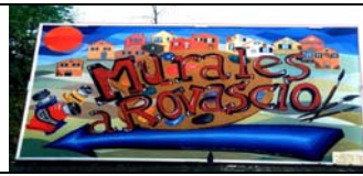
ROVASCIO - COMO