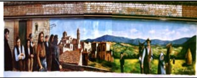
SAN FERMO - VARESE