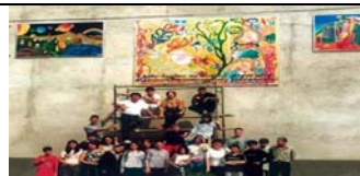
ROVASCIO - COMO