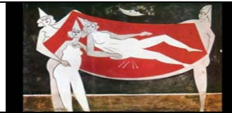
CERETE - COMO