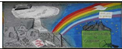
INDUNO OLONA - VARESE