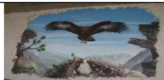
APRICA - SONDRIO