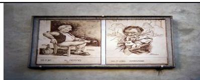
RUNO DI DUMENZA - VARESE