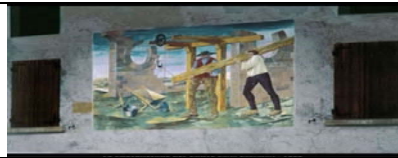
CALCIO - BERGAMO